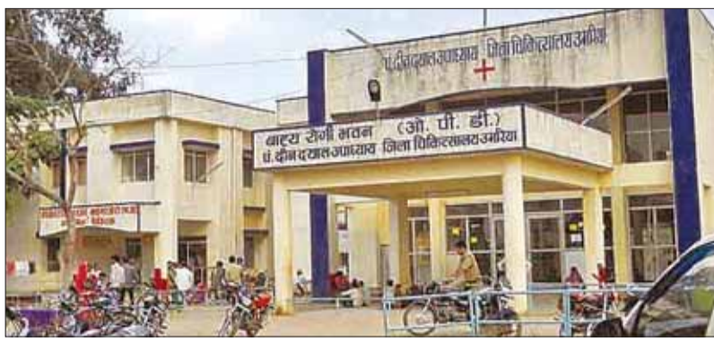
शिकायतकर्ता पर दबाव बनाने धमकाने का किया महिला कर्मचारी ने प्रयास